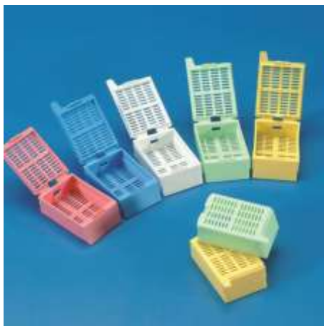
КАССЕТЫ ДЛЯ ЗАПОЛНЕНИЯ ТКАНЕЙ ТИПА МЕГА